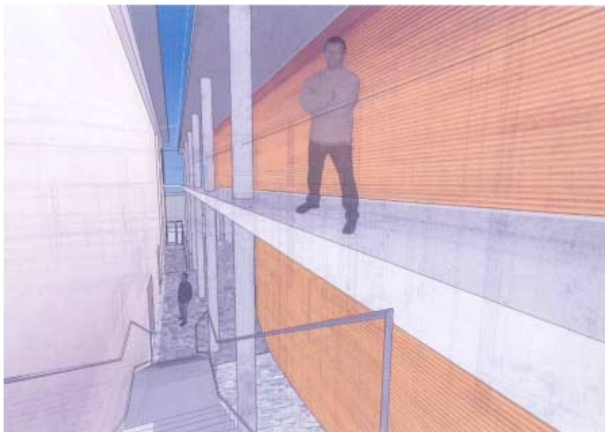
„Scena na Starówce” – wizualizacja, wewnątrz dobudowanej galerii