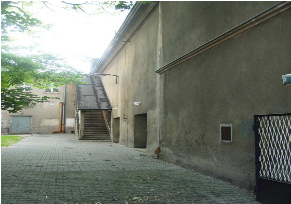
Kino „Na Starówce” – stan istniejący, wyjście tylne