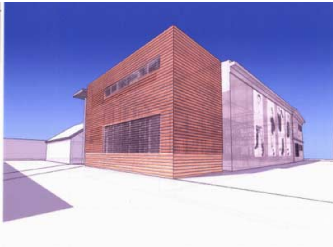
„Scena na Starówce” – wizualizacja, widok od ul. Bramkowej