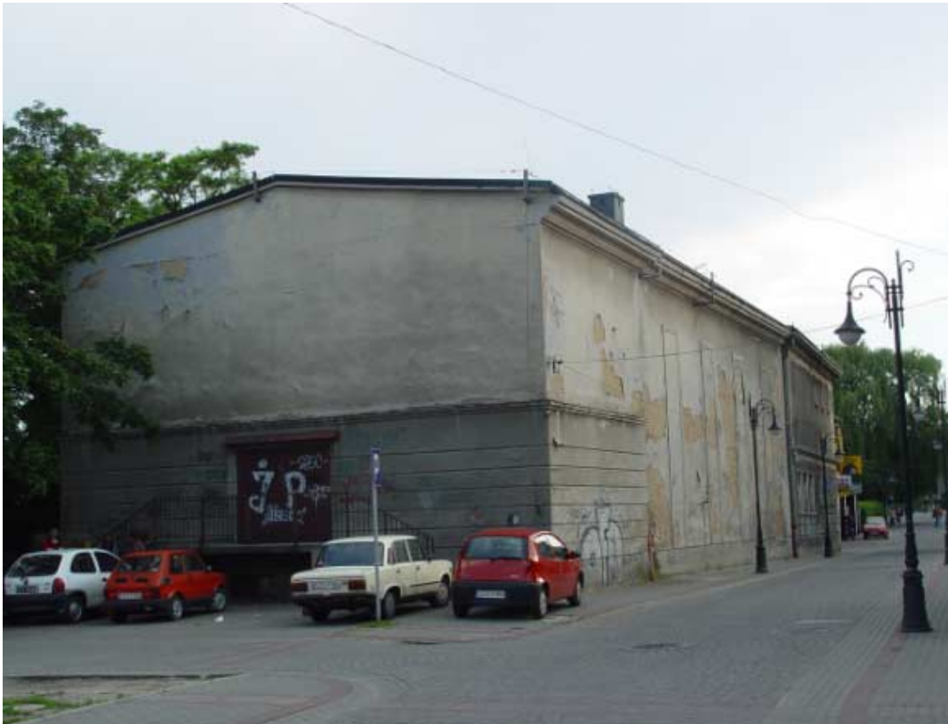
Kino „Na Starówce” – stan istniejący, widok od ul. Bramkowej