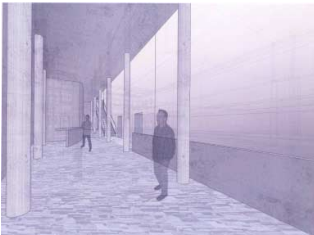
„Scena na Starówce” – wizualizacja, wewnątrz dobudowanej galerii