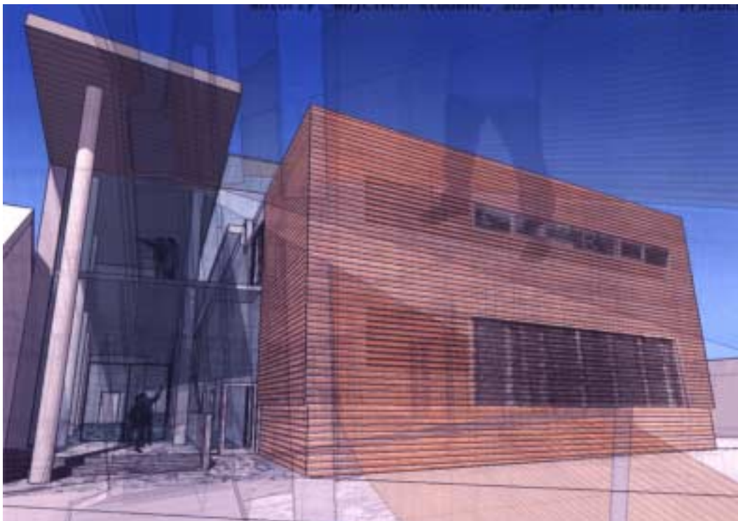
„Scena na Starówce” – wizualizacja, wyjście tylne