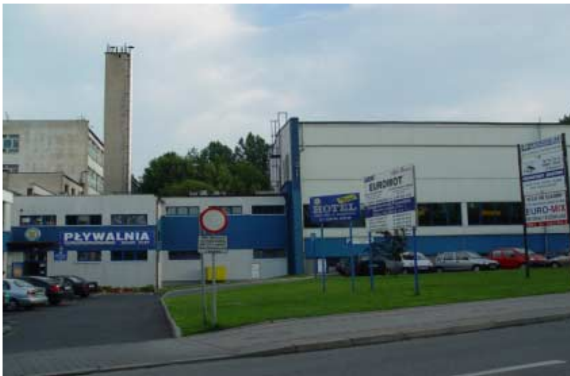
Pływalnia – stan istniejący, widok od ul. Wodzisławskiej

ścianami będzie dobrze komponować się z otoczeniem i nie będzie stanowić ani dysonansu, ani dominaty kompozycyjnej.