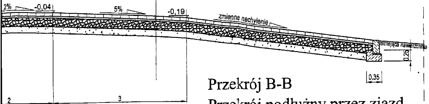
Przekrój B-B Przekrój podłużny przez zjazd